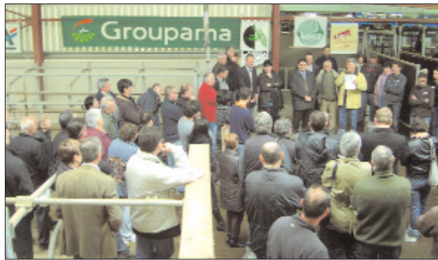
Rappel des enjeux de l'opération par les partenaires institutionnels et professionnels agricoles réunis sur la ferme laitière du GAEC IRINA.

Cela permettrait de désamorcer des conflits de voisinage, et apporterait une réelle image que mérite le monde agricole».