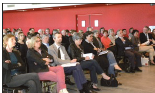
Les 120 participants à l'assemblée générale du Tourisme Vert dans la nouvelle salle du château de Mons.