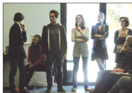
Présentation des nouveaux adhérents Bienvenue à la Ferme.