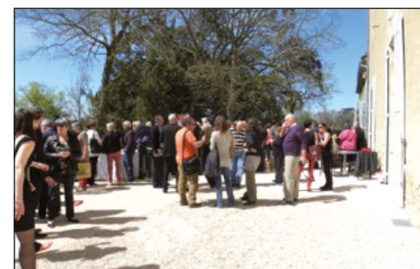
Un moment convivial à la fin des travaux a permis de réunir tout le monde sur la terrasse sud du château.