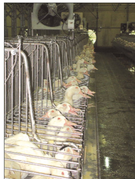
Cages collectives L640 - ETS SARRES chez Patrick BOURLETT à Saint-Blancard.

Cette plaquette est disponible sur demande au 05.58.85.43.99 ou sur le site : www.cepso.chambagri.fr