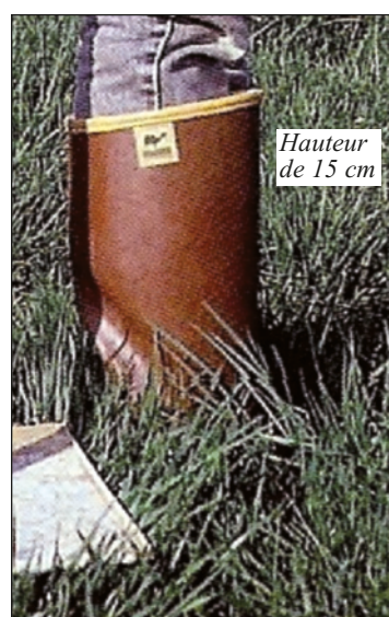
Hauteur de 15 cm