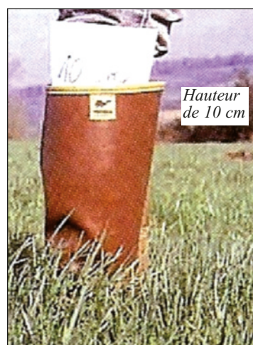
Hauteur de 10 cm

Si vous attendez d'avoir une hauteur "correcte" d'herbe sur la première parcelle, vous allez vous faire dépasser par la pousse. Dès lors, vous ferez pâturer une herbe trop haute qui sera mal valorisée par vos animaux. Il y aura des refus et donc, perte d'une partie de l'herbe produite !