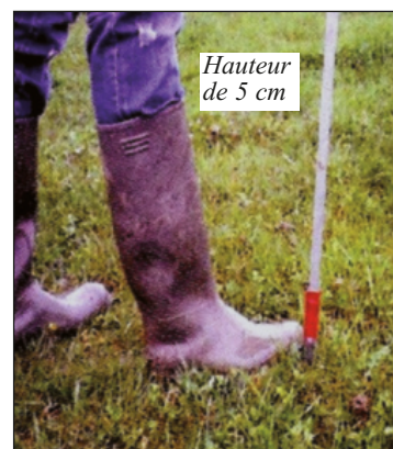
Hauteur de 5 cm

Une hauteur inférieure à 5 cm est également critique dans la gestion du parasitisme.