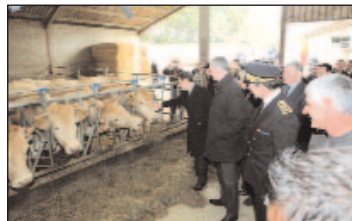
Le Président de la République visitant l'élevage.