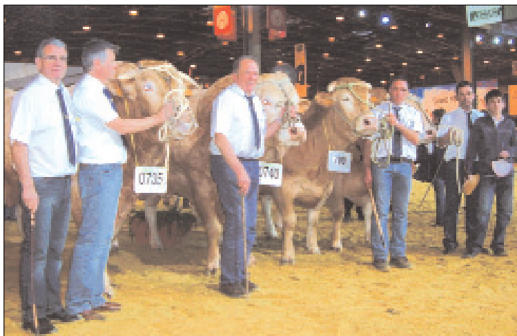
Les éleveurs de Blonde d'Aquitaine du Gers avec leurs animaux

■ L'élevage DUBOSC de Viella, présent à Paris pour la 10 ème fois en