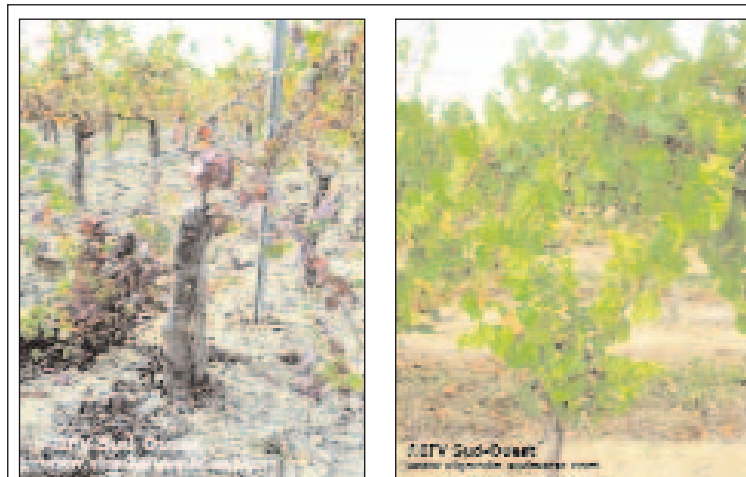
Symptômes de la flavescence dorée sur cépage rouge (gauche) et cépage blanc (droite).