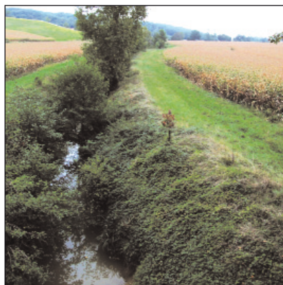
Tous les cours d'eau BCAE de l'exploitation devront être protégés en 2010. Cette exigence concernera tous les agriculteurs.

La BCAE «Bandes tampons» de 2010 est obligatoire pour toutes les exploitations traversées par un ou plusieurs cours d'eau BCAE.