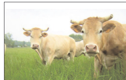
Une double exigence d'entretien et de maintien sera demandée pour les prairies en 2010. En particulier, la surface en prairies temporaires ne pourra diminuer de plus de 30 %.

- les prairies temporaires peuvent être retournées mais la diminution de leur surface ne pourra dépasser 30 % par rapport à la surface de référence.